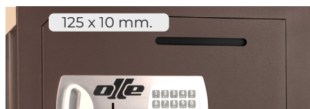
Buzón Serie 1000 1000 Series slot Fente Série 1000