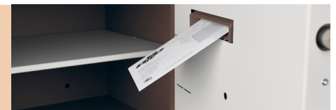
Apertura izquierda Left-side opening Ouverture à gauche