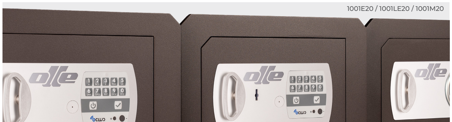
1001E20 / 1001LE20 / 1001M20

Les nouvelles fonctions de la serrure allant de la ouverture retardée à code de contrainte pour ouverture. En outre, elle incorpore la technologie bluetooth 4.0 pour se connecter à n'importe quel appareil IOS ou Android à travers d'une application.